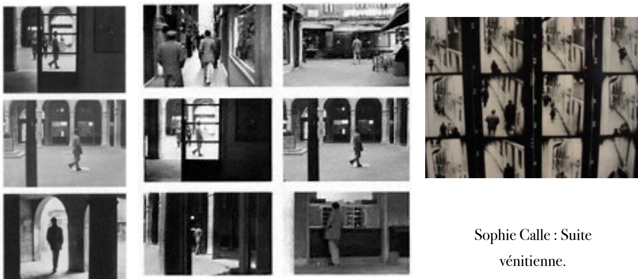
Sophie Calle : Suite vénitienne.

En lien avec le travail en littérature sur le roman policier